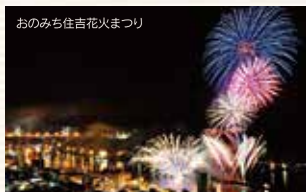
おのみち住吉花火まつり