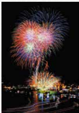
第11回フォトコンテスト推薦作品【尾道水道に咲く大輪の華】

その平山奉行の功績を称えるためと、住吉浜の海産物問屋の旦那衆が商売の繁盛と海上交通の安全を願って、江戸中期から始められたもので、西の両国花火(現在の隅田川花火大会)とさえ云われた華やかな花火まつりです。