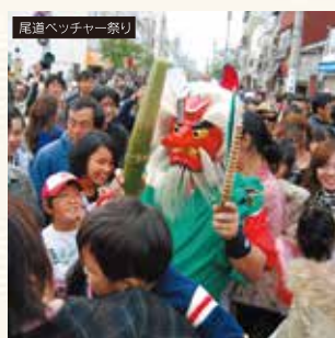
尾道ベッチャー祭り

※各イベントの開催時期は目安となります。 詳細は、尾道観光協会「おのなび」HP 等をご参考ください。